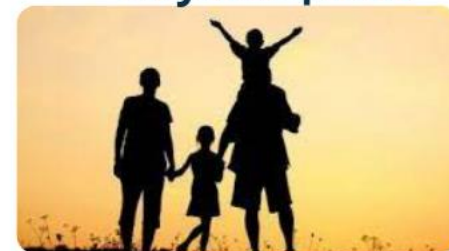
и членами их семей

Изменения внесены в статью 12 Закона Республики Казахстан "О противодействии коррупции" от 18 ноября 2015 года № 410-V ЗРК.