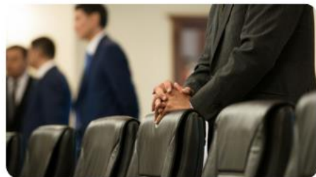
госслужащими корпуса «А»