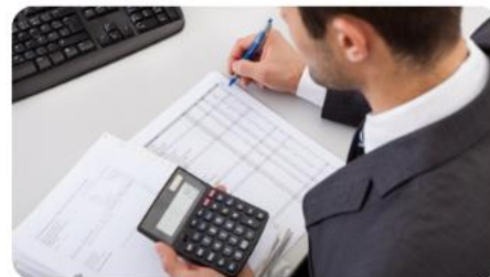
управленцами квазигосударствен- ного сектора